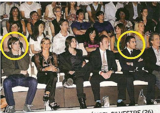
JOSH HARTNETT (30) Y MIGUEL ÁNGEL SILVESTRE (26)